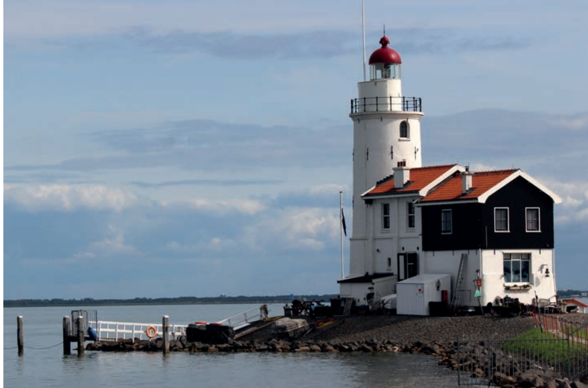
Het paard van Marken

rectie op integere en verantwoorde wijze het beleid van het SFM gedurende 2021 vorm en inhoud heeft gegeven.