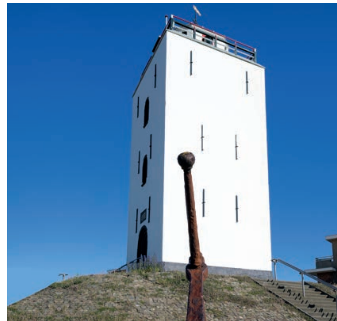
Katwijk aan Zee