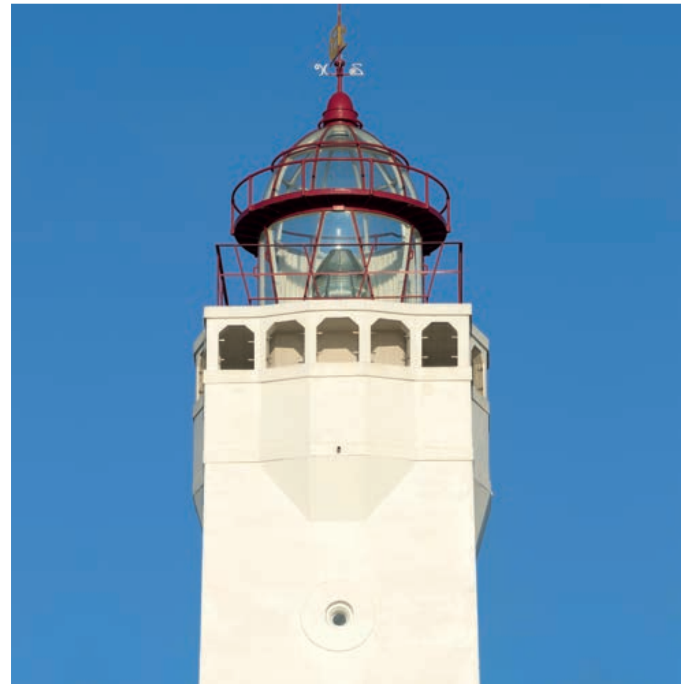
Noordwijk aan Zee

In de tweede helft van 2021 werd duidelijk dat het SFM moet kijken of de leden voorkomen op de nationale en Europese fraudelijsten. Daartoe zijn van alle leden met rechtspersoonlijkheid zogenaamde UBO-ver-