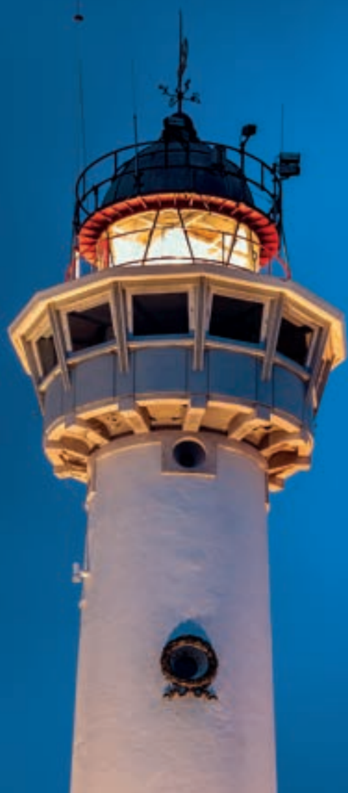
J.C.J. van Speijk, Egmond aan Zee